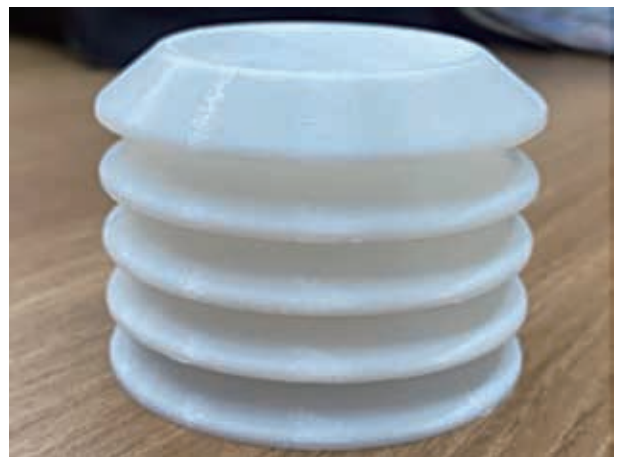
3Dプリンタで出力した自然通風シェルタ