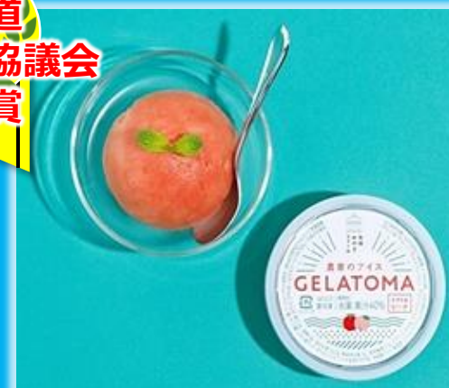
「農家のアイスGELATOMA」石狩みのりファーム(石狩市)