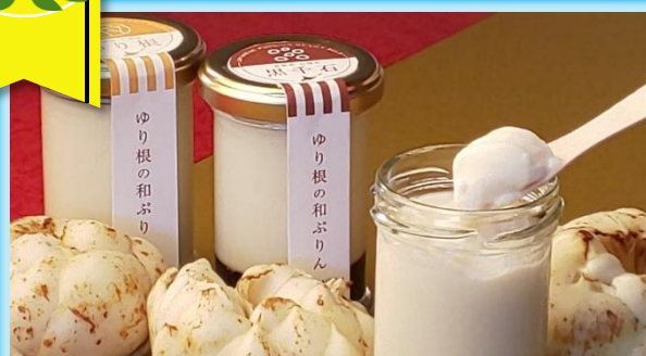
「ゆり根の和ぷりん(黒千石)」居酒屋 和がや(乙部町)