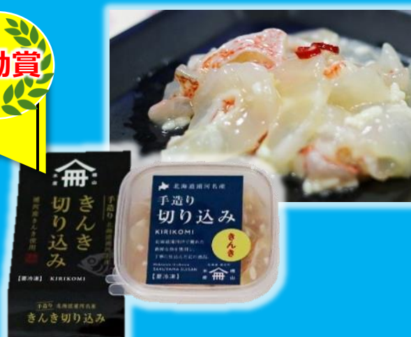
高級魚の塩麹漬け「きんき切り込み」(有)柵山水産(浦河町)