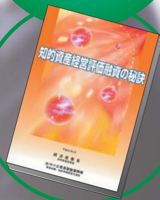
手引書『知的資産経営評価融資の秘訣』を呈呈します

地域密着型金融の担い手(=資金の貸し手) はもとより、知的資産を活かして事業を 成長させたい企業(=資金の借り手)も必見です。